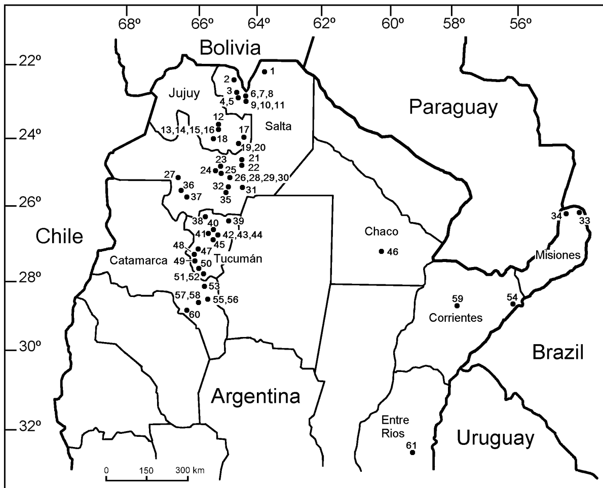
FIGURE 2. Map of northern Argentina showing the localities mentioned in text. All numbered localities are listed in the Appendix.

We also add new records for the Humid Chaco, Fields and Wedlands, and Pampas ecoregions that previously had few bat reports. For the others ecoregions, we add several occurrence points in areas with a small number of data. For example, we report many localities for the 25°S latitude in the Yungas forests. Forty three of the new localities presented here were not previously sampled.