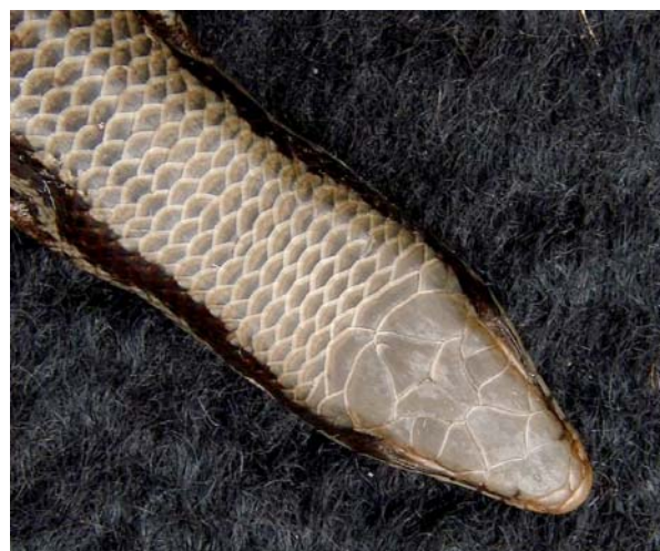
Figure 2. Detail of the head of a Mabuya frenata specimen (MZUFV 467) from the Pico do Ibituruna, Minas Gerais, Brazil. Note the fused frontoparietal scales, characteristic of this species.