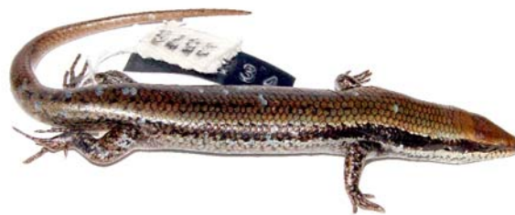
Figure 1. Specimen of Mabuya frenata (MCN-R 2578) from Parque Nacional das Sempre Vivas, Minas Gerais, Brazil.

Our report is based on 51 specimens housed at the following scientific collections: Museu de Zoologia "João Moojen" (MZUFV), Universidade Federal de Viçosa , in Viçosa, Minas Gerais; Laboratório e Museu de Zoologia (LMZ) , Universidade Federal de Alfenas , in Alfenas, Minas Gerais; Laboratório de Zoologia dos Vertebrados (LZV) , Universidade Federal de Ouro Preto , in Ouro Preto, Minas Gerais; Museu de Ciências Naturais (MCN) , Pontifícia Universidade Católica de Minas Gerais , in Belo Horizonte, Minas Gerais; and Museu de Zoologia (MZUSP) , Universidade de São Paulo , in São Paulo, São Paulo.