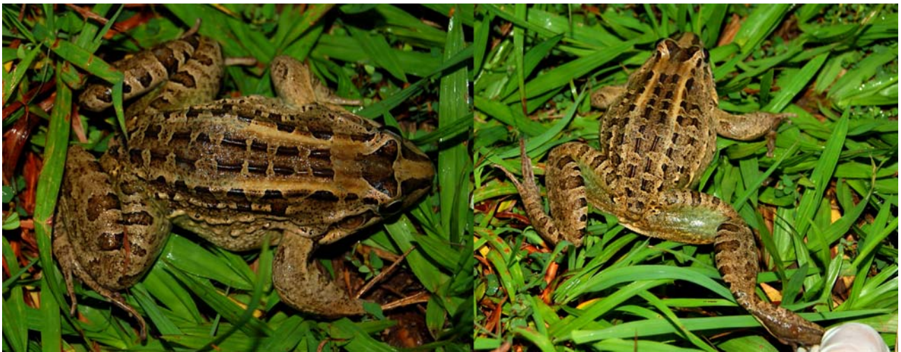
Figure 1. Leptodactylus chaquensis showing the brownish dorsal coloration and posterior surface of the thighs with a uniform dark green coloration.